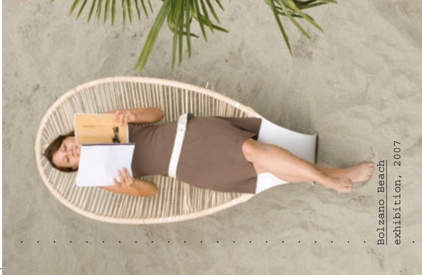
Bolzano Beach exhibition, 2007