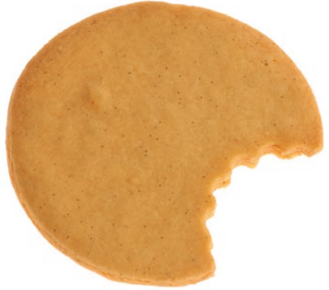
Design: Studio 7.5