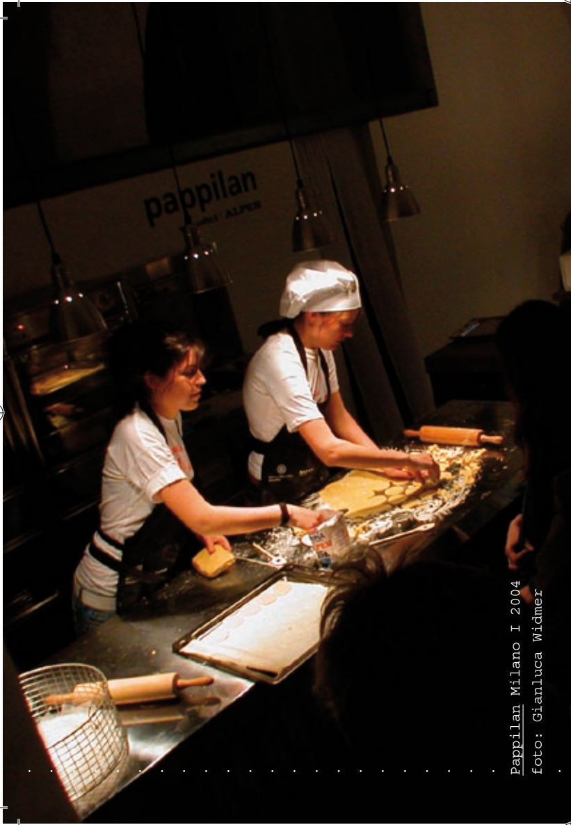
Pappilan Milano I 2004