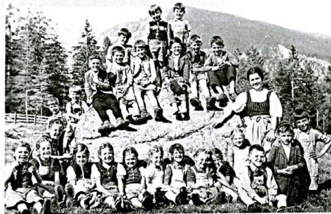
Gita primaverile della scuola elementare di Stulles / Bolzano, anni '40

lamente le scuole con 5 o 7 alunni. In Alto Adige, ad esempio, gli alunni sono riuniti in un'unica classe se non sono più di 12. Nel caso di comunità scolastiche più grandi, s'istituiscono due classi. In molte regioni alpine, circa un quarto delle scuole elementari è composto da meno di 25 alunni. Per questo motivo utilizziamo il numero 25 come parametro di riferimento per la definizione di "piccola scuola". Va comunque rilevato che nel frattempo, la Germania settentrionale e la Norvegia hanno assorbito quasi tutte le piccole scuole e che oggi la definizione "piccola scuola"