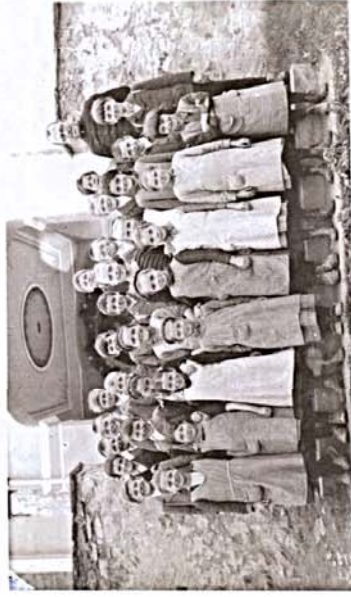
Scuola elementare di Sant'Andrea - Bressanone, anni '30