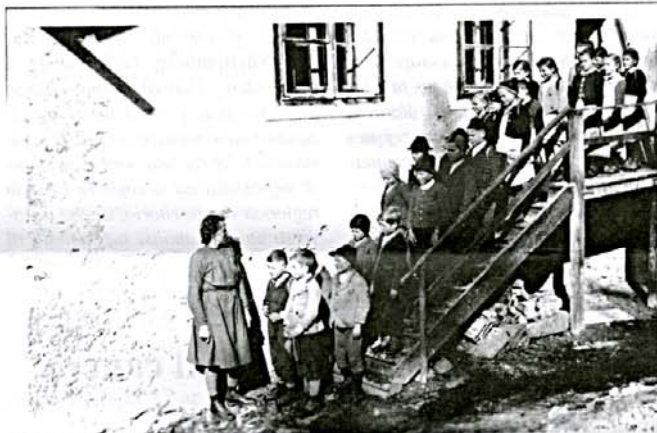
Ridanna (Bressanone) - Fine della giornata scolastica, anni '40.

Infatti, anche gli insegnanti devono cogliere questa sfida. Devono essere dei veri "tuttofare". Riuscire a completare i cinque programmi annuali per tutte le materie previste, richiede un grande lavoro di pianificazione e un'enorme capacità organizzativa. Mentre nelle scuole altoatesine gli insegnamenti di religione e di seconda lingua vengono impartiti da maestri distinti, in altri paesi gli insegnanti devono arrangiarsi da soli. Uno degli aspetti più volte espressi durante il Convegno è senz'altro l'isolamento del corpo insegnante. Anche per loro la creazione di reti di collaborazione è oggi facilitata dai media digitali.