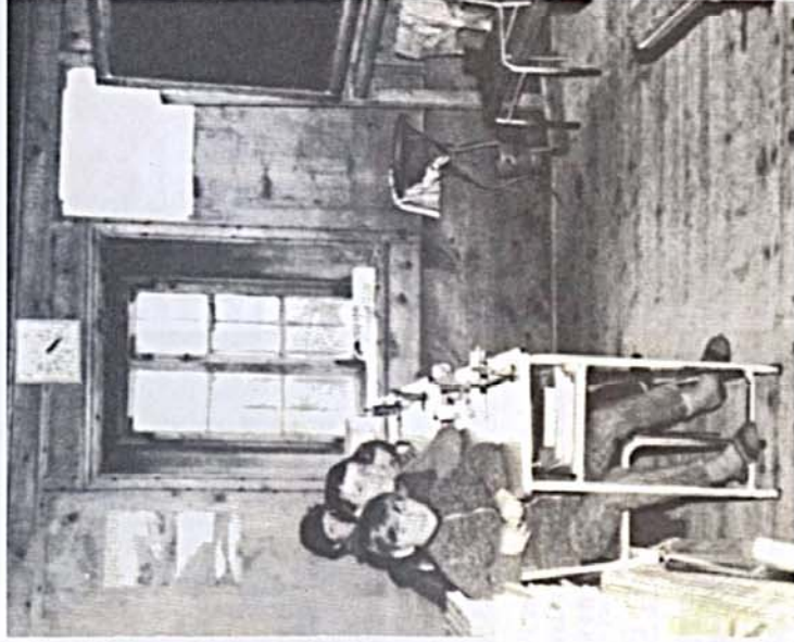
La Piccola Scuola di Dun (Brunico), anni 60.