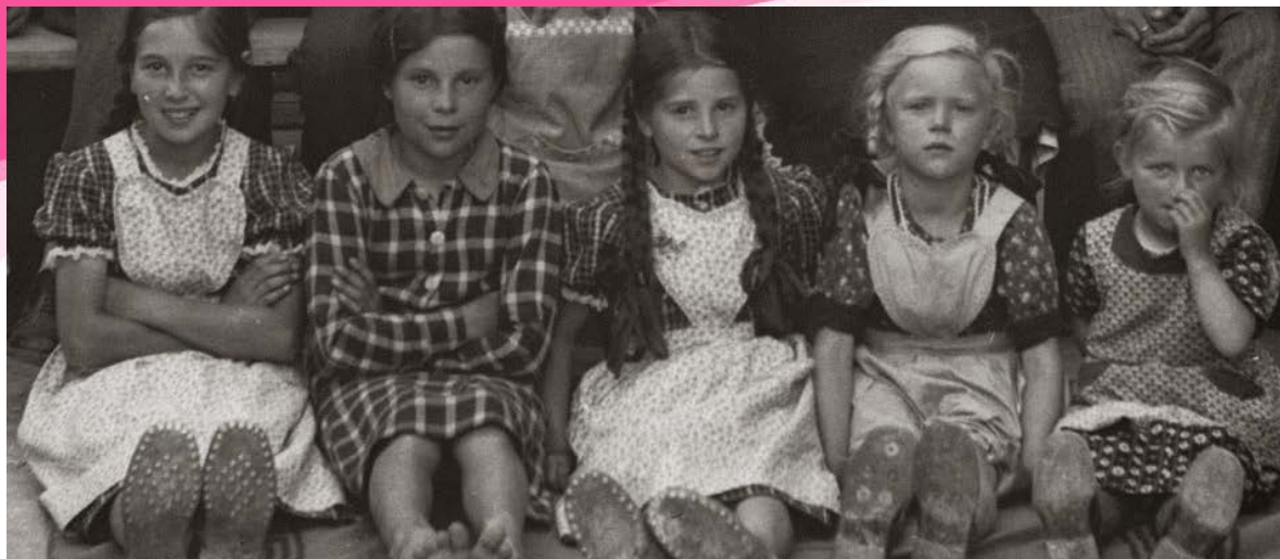
Schulkinder der Zwergschule am Oberwieshof auf dem Partschinser Sonnenberg auf 1.334 Höhenmetern